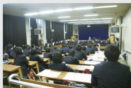
就職オリエンテーションの様子

タイガー魔法瓶・エクセディ・天辻鋼球・大幸薬品・クラシエ製薬・森下仁丹・本荘ケミカル・京セラドキュメントソリューションズ・DNPテクノパック・ジェイフィルム大阪工場・倉敷紡績寝屋川工場・恩地食品・山崎製パン・明治油脂・家永技研・阪神阪急ホテルズ・きんでん・アイリスオーヤマ・タイロン・京阪百貨店・平和堂・つるや・上新電機・トヨタテックス大阪・公務員（自衛官一般曹候補生、自衛官候補生） 他