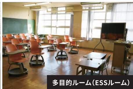
多目的ルーム(ESSルーム)