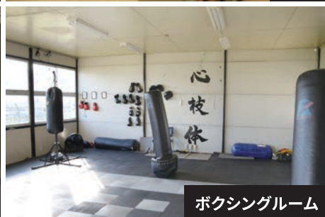
ボクシングルーム